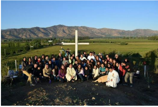
Colonias Urbanas y parte de la pastoral juvenil (Parroquia San Gaspar Bertoni)