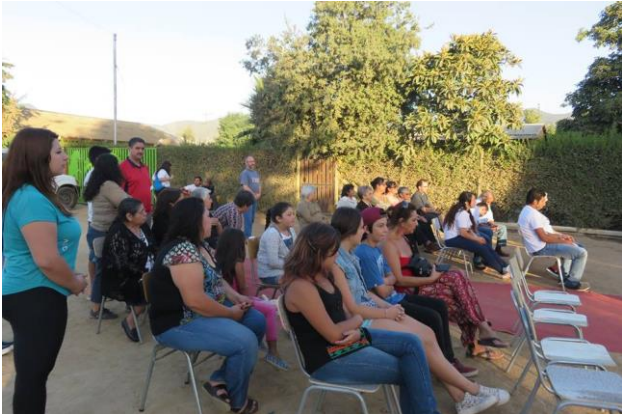
Misiones "Rinconada", 2016 (Parroquia Nuestra Señora de Montserrat)