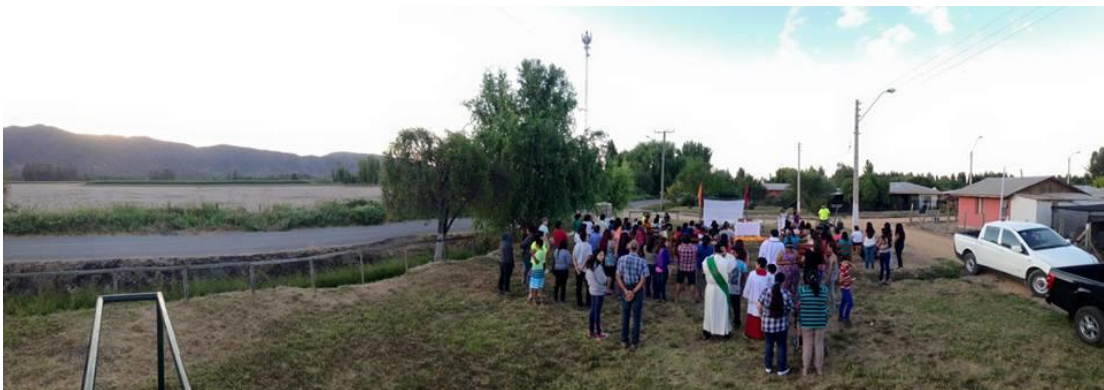
Misiones “Rinconada”, 2017 (Parroquia Nuestra Señora de Montserrat)