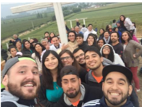
Misiones “Rinconada”, 2018 (Parroquia Nuestra Señora de Montserrat)