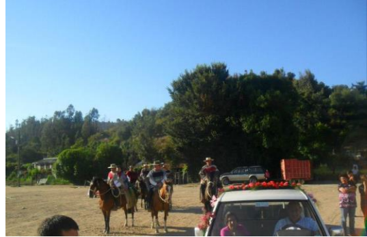
Misiones “El asilo”, 2014 (Parroquia Santa Teresa de los Andes)