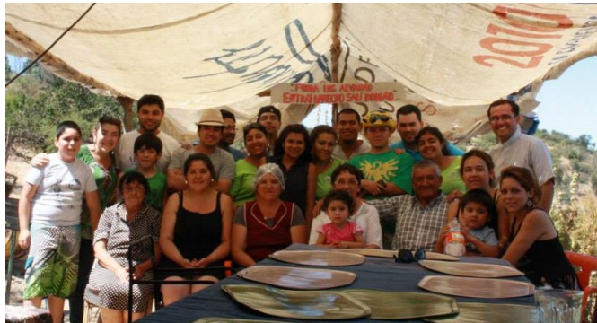
Misiones “El asilo”, 2015 (Parroquia Santa Teresa de los Andes)