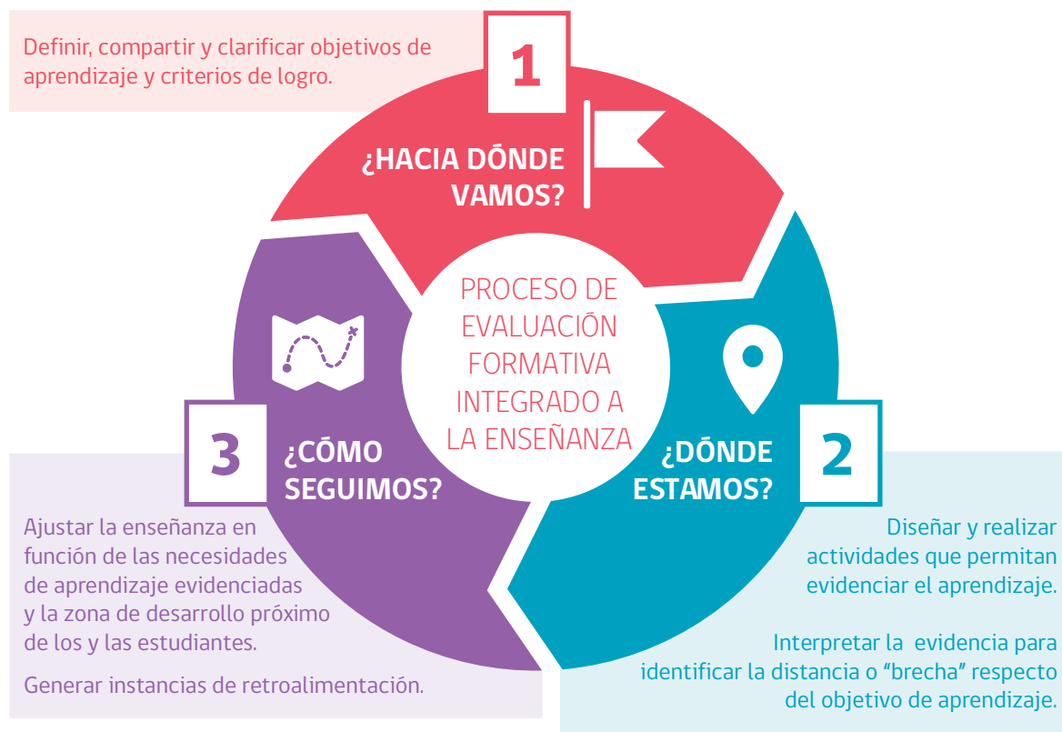
Figura 2. Proceso de evaluación formativa integrado a la enseñanza.

Las estrategias de evaluación formativa revisadas en esta sección se pueden entender como un ciclo o proceso continuo, integrado a la enseñanza 37 , liderado por el o la docente, con un alto involucramiento de las y los estudiantes. La figura 2 ilustra este ciclo de evaluación formativa y sus elementos: