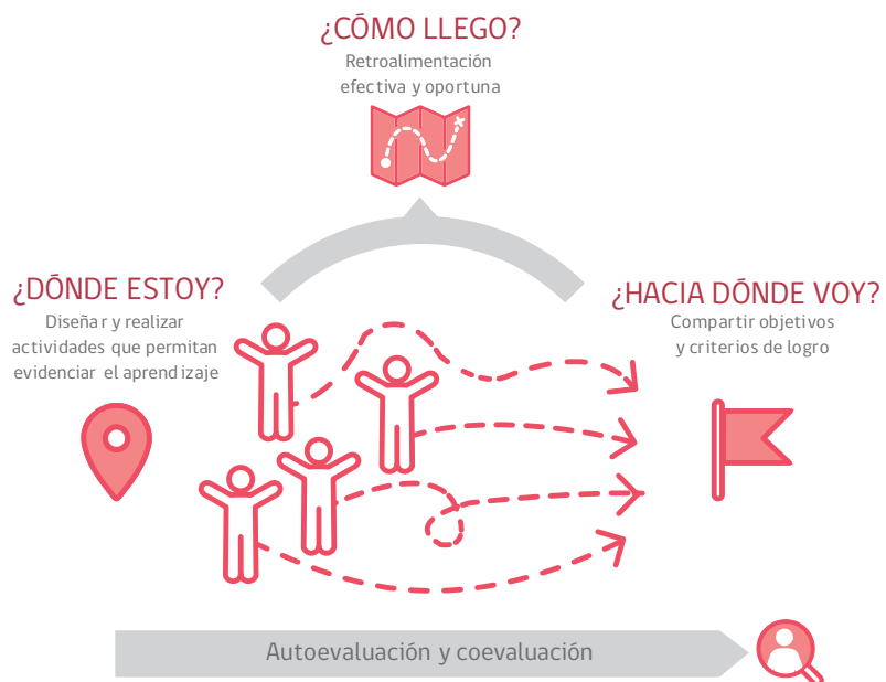
Figura 1. Preguntas y estrategias centrales de la evaluación formativa.

La figura 1 ilustra cómo se relacionan las estrategias de evaluación formativa con estas preguntas: visualizar “Hacia dónde voy” requerirá trabajar con los y las estudiantes para que comprendan los objetivos de aprendizaje y sus criterios de logro; para entender “Dónde estoy” habrá que realizar actividades de aprendizaje y evaluación que generen evidencia sobre el lugar en el que se encuentran los y las estudiantes en su trayectoria hacia el aprendizaje que se busca lograr; efectuar acciones para acercarse al objetivo (“Cómo llego”) implicará retroalimentar de manera oportuna a los y las estudiantes considerando sus características y necesidades, y ajustar la práctica pedagógica para apoyarlos del mejor modo posible. Por último, la cuarta estrategia de evaluación formativa de auto- y coevaluación cruza transversalmente y es alimentada por las tres estrategias mencionadas.