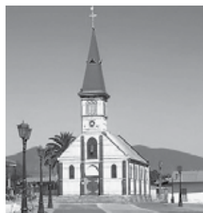
Iglesia Guayacán, Coquimbo, Chile