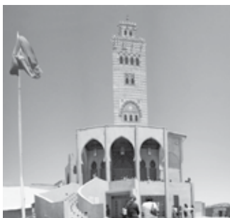
Mezquita, Coquimbo, Chile

Los alumnos observan distintas imágenes de construcciones que tienen fines comunes, pero que reflejan la diversidad cultural de Chile. Guiados por el docente, comentan las imágenes y concluyen que la diversidad de costumbres, celebraciones, construcciones, etc., tiene relación con el aporte de diversas culturas a nuestra identidad. A modo de ejemplo, se proponen imágenes de construcciones de la ciudad de Coquimbo, que reflejan la diversidad religiosa.