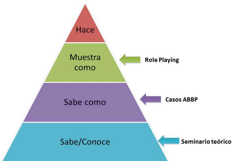
Figura 3. Distintos niveles en la enseñanza de la bioética.

Fuente: Bosch J, Briceño H, Capella D, Castro C, Farres R, Quintana A, et al. Enseñar bioética a estudiantes de medicina mediante el aprendizaje basado en problemas (ABP). Cuadernos de Bioética. 2015; 26(2): 303-309.