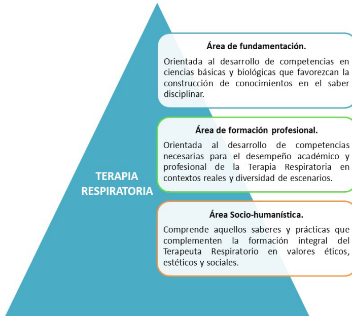
Figura 2. Áreas de formación del terapeuta respiratorio.