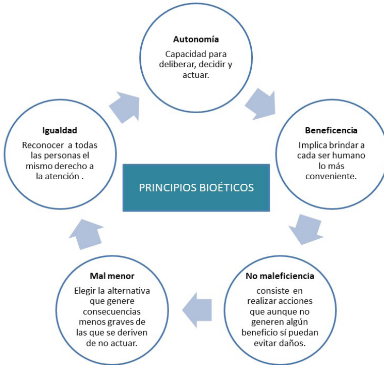
Figura 4. Principios bioéticos.