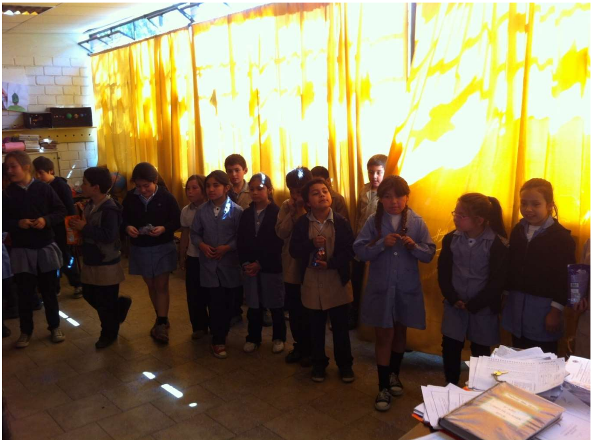
Alumnos de tercero básico, colegio Lo Cañas