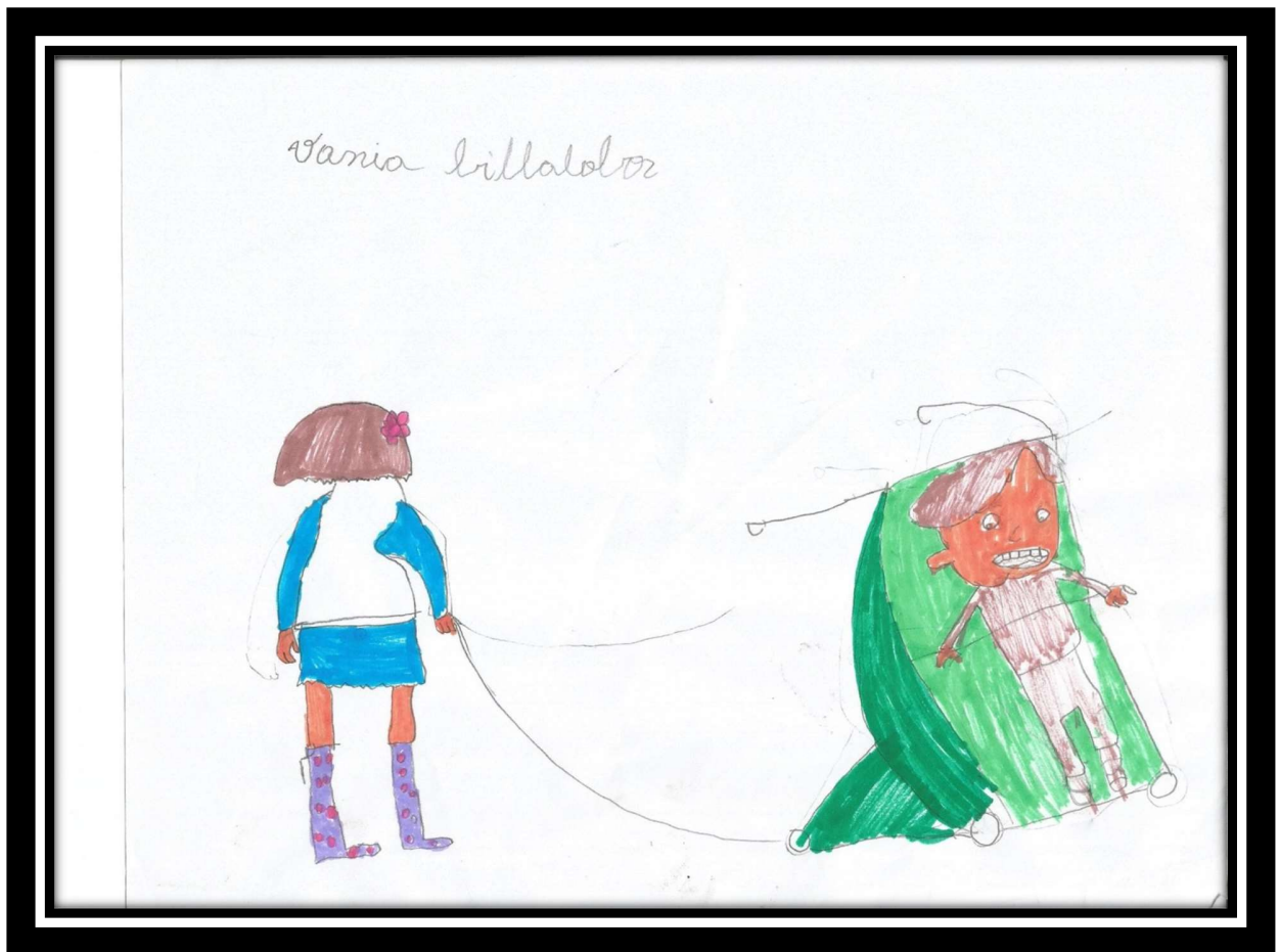
Niña de cuarto básico expresando sus percepciones y emociones tras ver un video