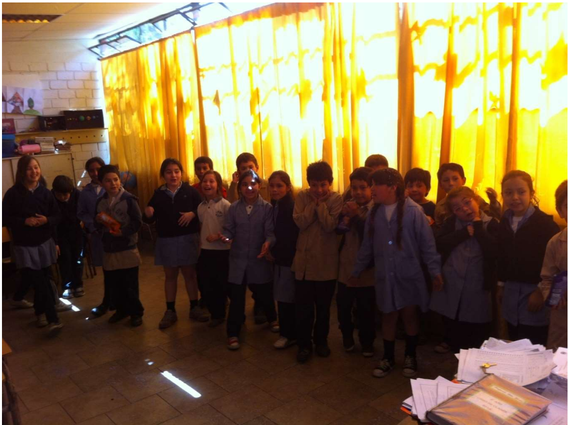
Alumnos de tercero básico, colegio Lo Cañas