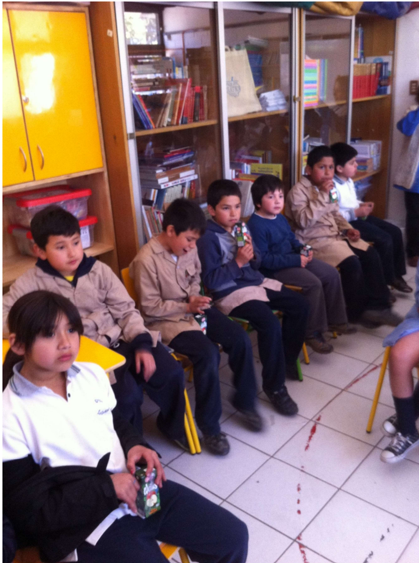
Alumnos de tercero y cuarto básico, colegio Lo Cañas