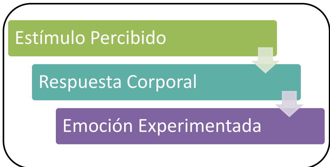
Tabla 2: "Representación gráfica del párrafo anterior".

persona está enojada, triste, feliz, etc. Además, asegura que estas expresiones emocionales siempre comunican algo, incluso en la comunicación no verbal.