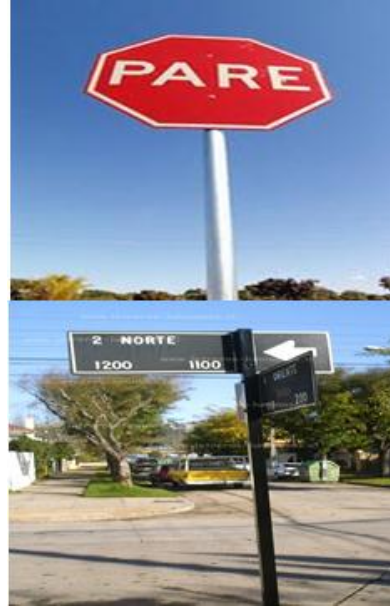
Figura 13.- Tarjeta 11, Mejoramiento de Señales Informativas