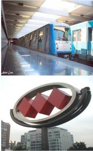
Figura 11.- Tarjeta 9, Metro de Santiago