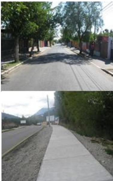
Figura 4.- Tarjeta 2, Pavimentación de Calles y Veredas