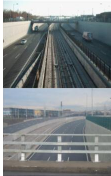
Figura 5.- Tarjeta 3, Autopista Vespucio Sur