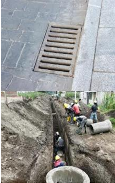
Figura 3.- Tarjeta 1, Alcantarillado