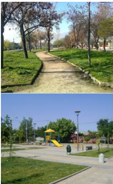
Figura 12.- Tarjeta 10, Mejoramiento de Parques y Plazas Peatonales