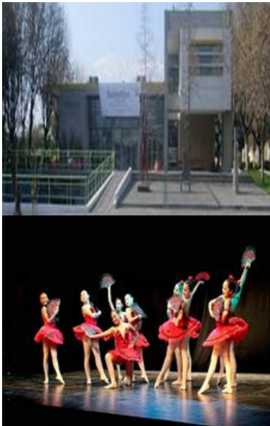
Figura 8.- Tarjeta 6, Centro Cultural Espacio Matta