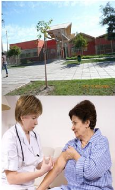
Figura 7.- Tarjeta 5, Centro de Salud Pública