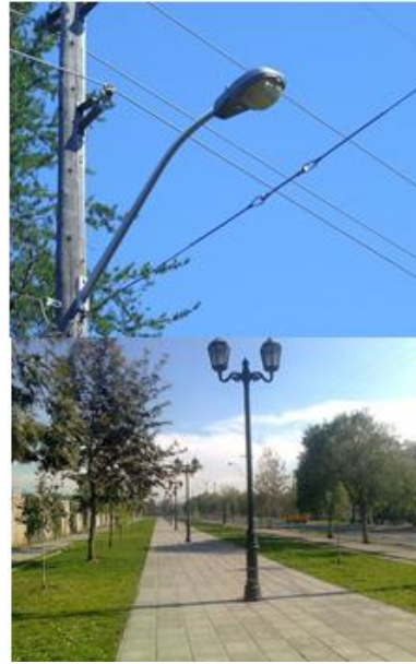
Figura 9.- Tarjeta 7, Iluminación