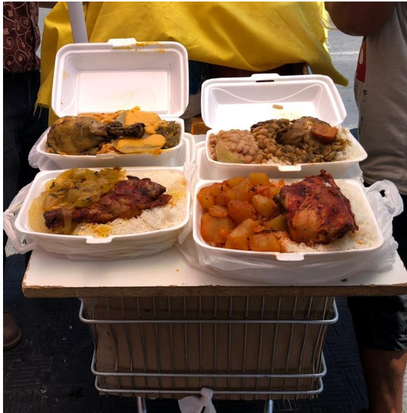
Ilustración 5 | Gastronomía peruana