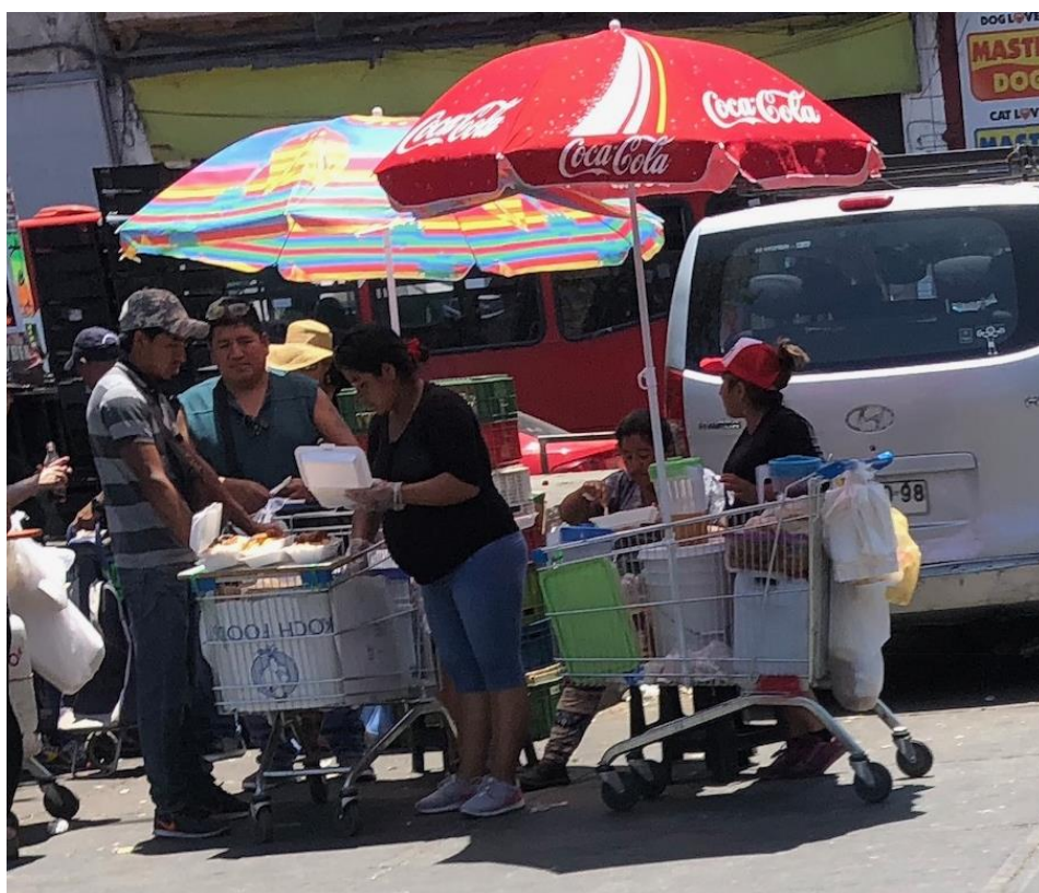
Ilustración 4 | Vendedores peruanos