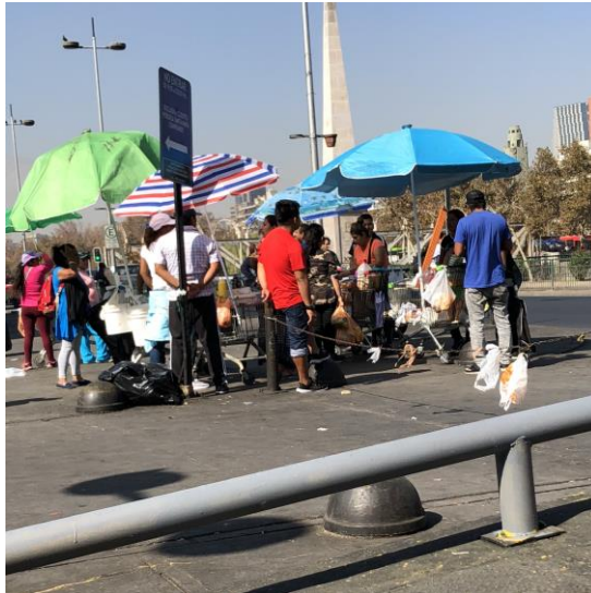
Ilustración 2 | Vendedores de comida