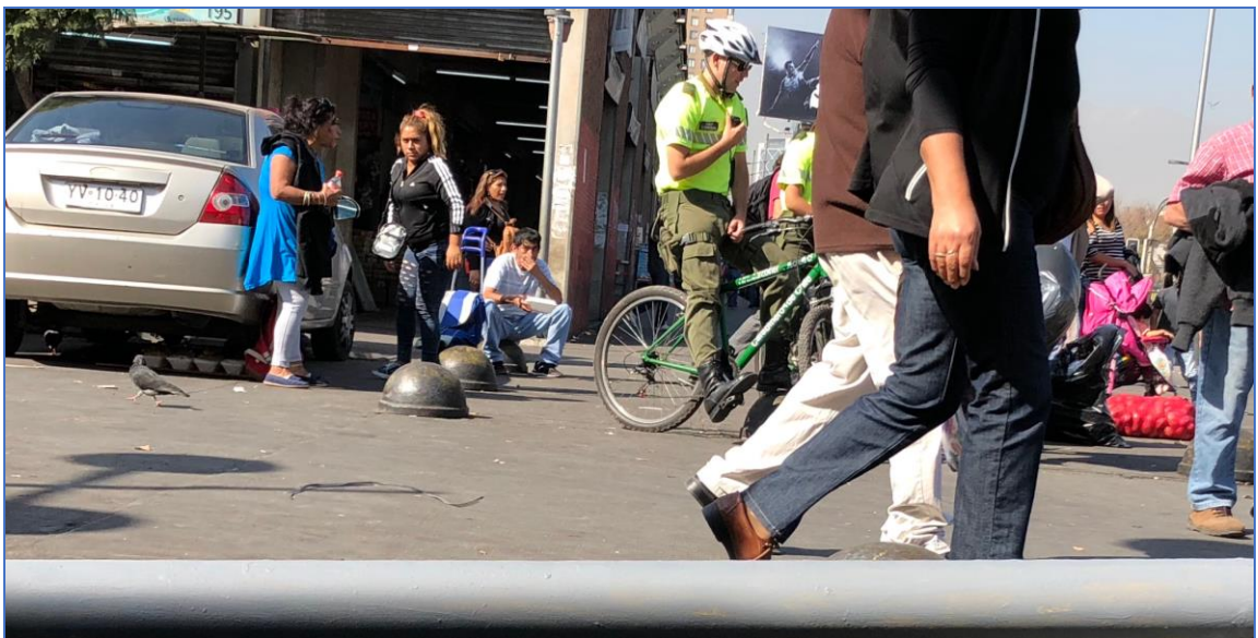
Ilustración 3 | Carabineros en el lugar de venta de comida