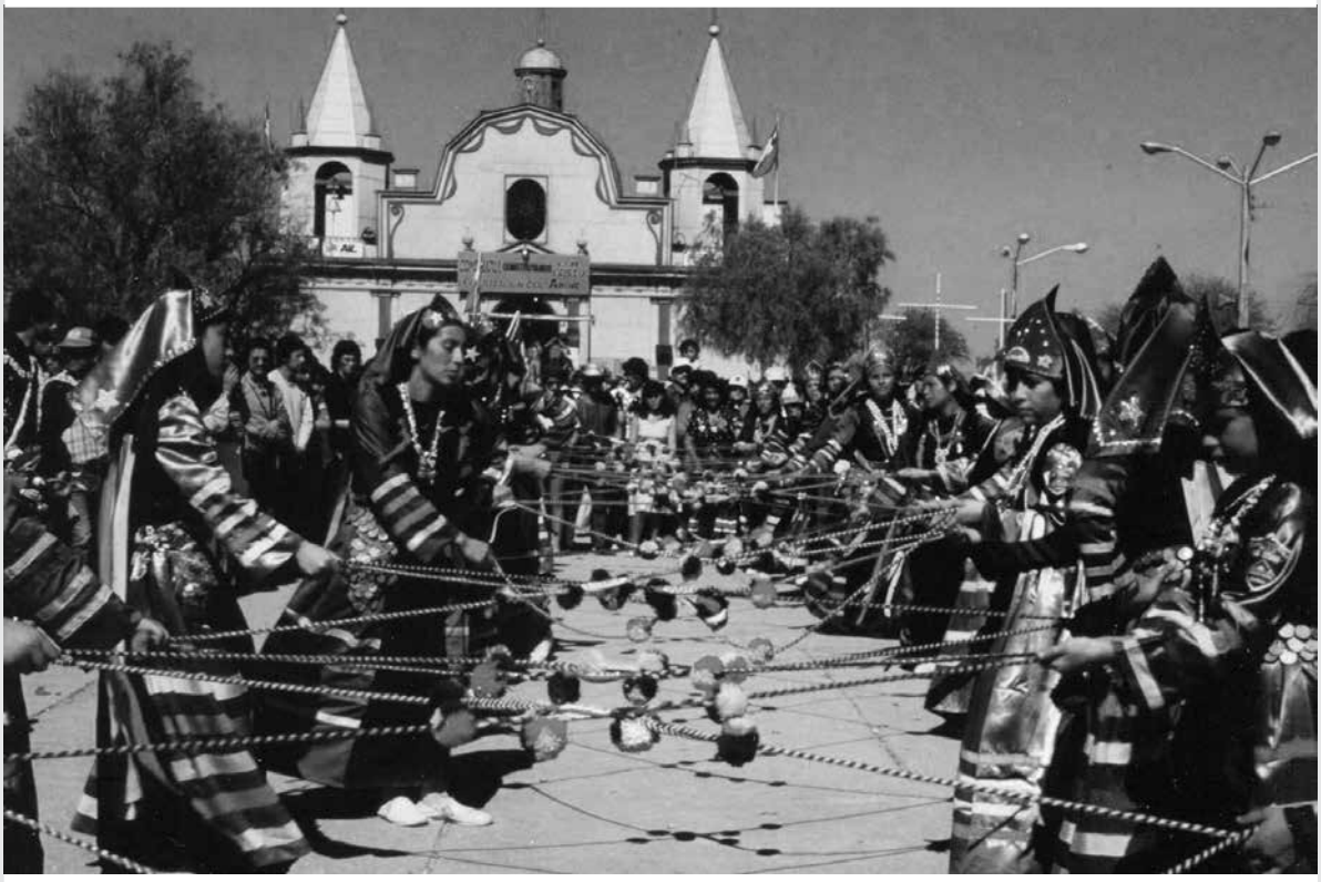
Cuyacas, figura la red.