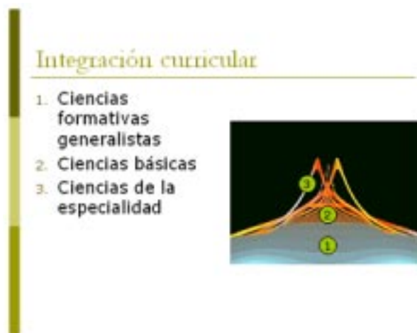
Gráfico N° 3 Propuesto por el autor para mostrar la relación en un currículo entre asignaturas de carácter generalistas formativas, básicas y de especialización, jugando un rol determinante las primeras. En el caso chileno, las asignaturas de formación general fueron abortadas por el sistema educacional en tiempos de la dictadura. Las "expulsiones de lava" (3) del volcán expresarían las asignaturas de especialización, las cuales se van renovando constantemente por su corta validez debido a la velocidad del cambio. Estas asignaturas se perfilan en función de las asignaturas de carácter básico y formativas generalistas

La calidad de la educación se rebaja porque estos conocimientos inmediatistas quitan toda posibilidad de formar pensamiento crítico frente a las consecuencias sociales que las políticas neoliberales han desatado en nuestros países. Este pensamiento técnico y funcional sólo es capaz de entregar representaciones de relaciones entre experiencias sensibles, suponiendo que los conocimientos son sólo hechos y sus nexos con otros hechos, sistematizándolos al margen de la totalidad a la cual pertenecen. Al mismo tiempo parte de enunciados singulares para obtener conclusiones universales, viendo en forma fragmentada la realidad social, porque no integra conocimientos para ver esa realidad, observando sus partes como existencias separadas y no como un todo. (Ver más: http://www.mercadonegro.cl/snoticias_abril/educacion_mercancia.htm y http://www.mercadonegro.cl/sopinion/opinion_web_resumen_riveros.htm )