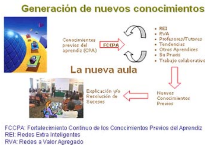
Gráfico N° 5 Propuesto por el autor para mostrar el proceso de desarrollo de los conocimientos y generación de conocimientos nuevos en un aula intermediada por NTICs Diseño del gráfico: Antonio Castillo Belmar, Ingeniero Civil Químico, profesor de la Universidad de Las Américas

Estos autores nos señalan que la auto-conciencia es una actividad experiencial-operacional, es decir, formas de cognición, de afirmaciones (teorías) derivadas acerca de la praxis del vivir que es definida y constituida por el observador. Desde esta perspectiva se debe potenciar la participación de los estudiantes como observadores en la generación de lo conocido. Entonces el estudiante-observador especifica el fenómeno, construye el mecanismo generativo desde sí mismo, crea un fenómeno distinto gracias al mecanismo explicativo (generativo) y luego lo valida. Y ello se repite recursivamente porque todo hacer nos lleva a un nuevo hacer como un círculo cognoscitivo. Maturana y Varela nos muestran esta nueva perspectiva sobre la naturaleza humana como una nueva cumbre desde la cual podemos visualizar coherentemente el propio "valle donde vivimos", desde donde alumnas y alumnos podrán construir y comprender el mundo que han construido y donde viven en convivencia con otros alumnos en la cultura que viven.