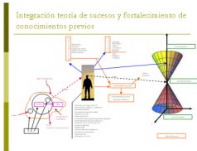
Gráfico N° 6 Propuesto por el autor con el fin de diseñar un modelo de resolución de problemas combinando teorías de Hawking, Maturana y Luhmann. Aquí se puede observar la relación entre la resolución de sucesos y el fortalecimiento constante de los conocimientos previos... Diseño del gráfico: Antonio Castillo Belmar, Ingeniero Civil Químico, profesor de la Universidad de Las Américas

Ahora bien, si el contenido del conocimiento - como señalan los biólogos antes mencionados- es el conocimiento mismo, y que los sistemas vivos no actúan por instrucciones o información que surgen como anomalía desde el entorno, y que por el contrario, los alumnos son capaces de generar mecanismos explicativos, coherencias operacionales, diversas teorías explicativas que genere por sí misma el fenómeno que se quiere explicar, hablamos entonces de auto-descripción o auto-conciencia. O si como apunta el sociólogo alemán, que los alumnos son "máquinas no triviales" con cierre autorreferencial, la didáctica debe apuntar como ciencia, práctica, tecnología y arte a fortalecer los conocimientos previos que alumnos/as poseen y desde donde se generan los nuevos conocimientos.