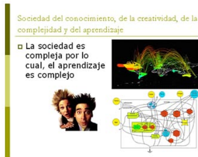
Gráfico N° 2 Propuesto por el autor para expresar el exceso de información aparentemente desvinculadas entre sí y que caracteriza la complejidad en la actual sociedad del conocimiento, y la actitud de sorpresa del observador mientras no construya los conocimientos previos adecuados para "ordenar" esa complejidad. Diseñado por Antonio Castillo Belmar, Ingeniero Civil Químico, profesor de la Universidad de Las Américas.

La sociedad del conocimiento y de la creatividad es una sociedad con sobreabundancia de datos y hechos los cuales deben ser ordenados, agrupados, analizados e interpretados y sintetizados. El aumento de la información cambia la percepción del modo de actuar sobre el mundo, el ritmo de nuestros archivos de imágenes, de pensar y sintetizar, de prever las consecuencias de nuestra acción, así como la interrelación de grandes fuerzas causales que generan los sucesos y la actitud de sorpresa del observador mientras no construya los conocimientos previos adecuados y debidamente fortalecidos para «ordenar» esa complejidad.