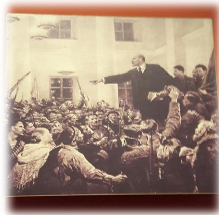
Figura 7: Vladimir Lenin, 1917