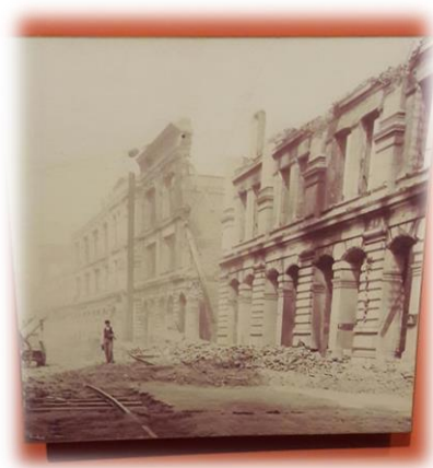
Figura 6: Terremoto Valparaíso 1906