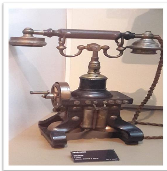
Figura 16: Teléfono, 1900.