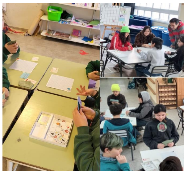
Imagen 2. Momento lúdico JAM en el aula

Mientras se desarrollaban las partidas (Imagen 2), los docentes y extensionistas iban brindando asistencia, evacuando las dudas que surgían en cada grupo. Todos pudieron realizar al menos 3 partidas (3 objetivos) ocupando un promedio de 40 minutos.