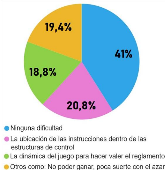
Gráfico 2. ¿Dónde tuviste dificultades con el JAM?

También se les preguntó acerca de las dificultades que se les presentaron en el juego y sus respuestas se exhiben en el gráfico 2.