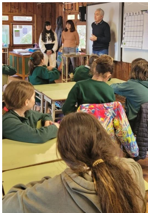
Imagen 1. Exposición del JAM en el aula

En todos los establecimientos se pautó la disposición sin interrupción de dos módulos (80 minutos), tiempo suficiente para realizar la presentación del equipo extensionista y del proyecto, la exposición del juego y de las instrucciones algorítmicas (Imagen 1), la realización de un simulacro del juego para enseñar el reglamento, la conformación de los equipos de estudiantes y el juego propiamente dicho.